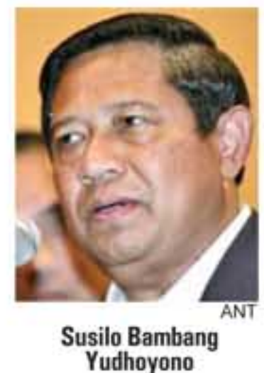
Susilo Bambang Yudhoyono

JOGJA: Presiden Susilo Bambang Yudhoyono (SBY) dijadwalkan bakal ngantor di Jogja, untuk memimpin dan memantau langsung tanggap darurat pasca-letusan Gunung Merapi, Jumat (5/11) dini hari kemarin.