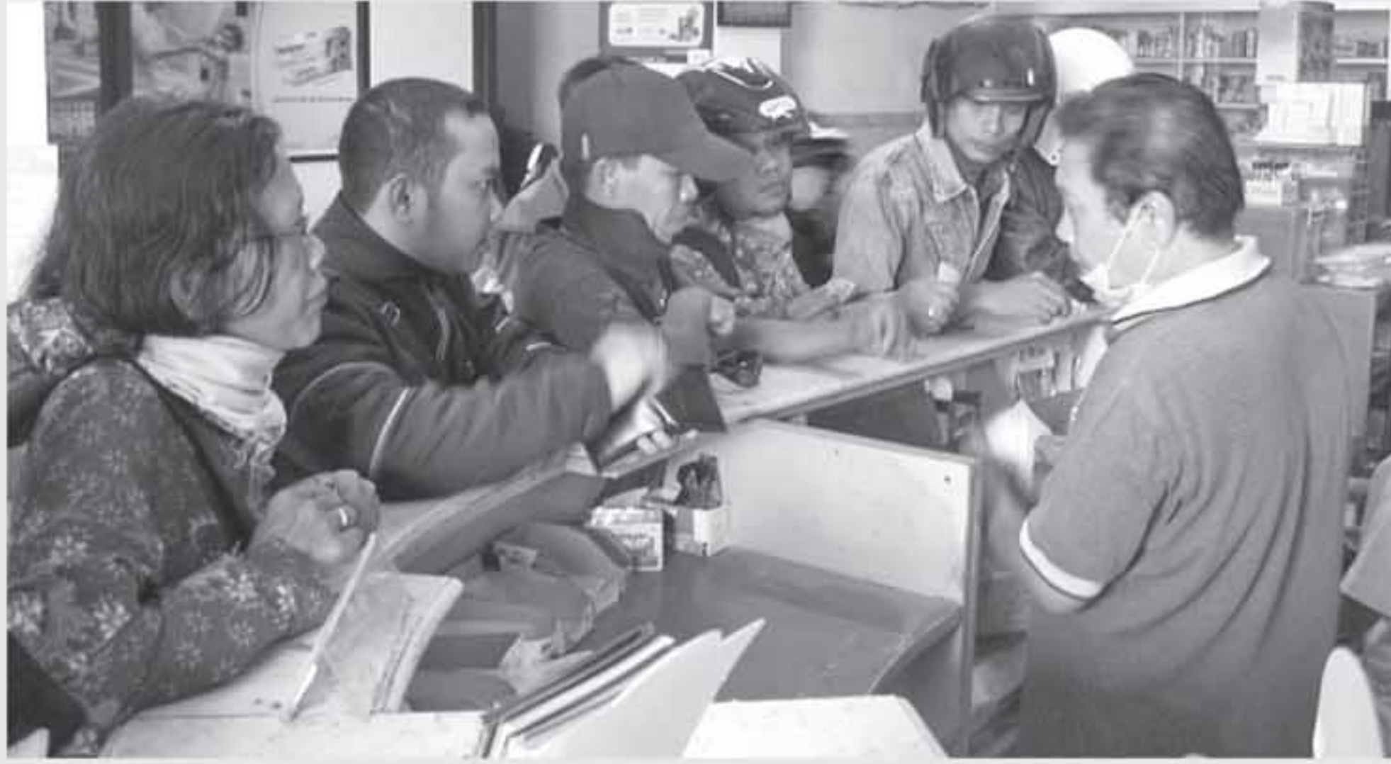
Sejumlah warga menyerbu apotek untuk mendapatkan masker, Jumat (5/11).

“Membaca berita di media, PDAM memiliki sumber air di kawasan Merapi. Saya berharap pemkot bisa menjamin ketersediaan air bersih meski Merapi pada saat ini dalam kondisi yang terus-menerus mengeluarkan awan panas,” ungkapnya.