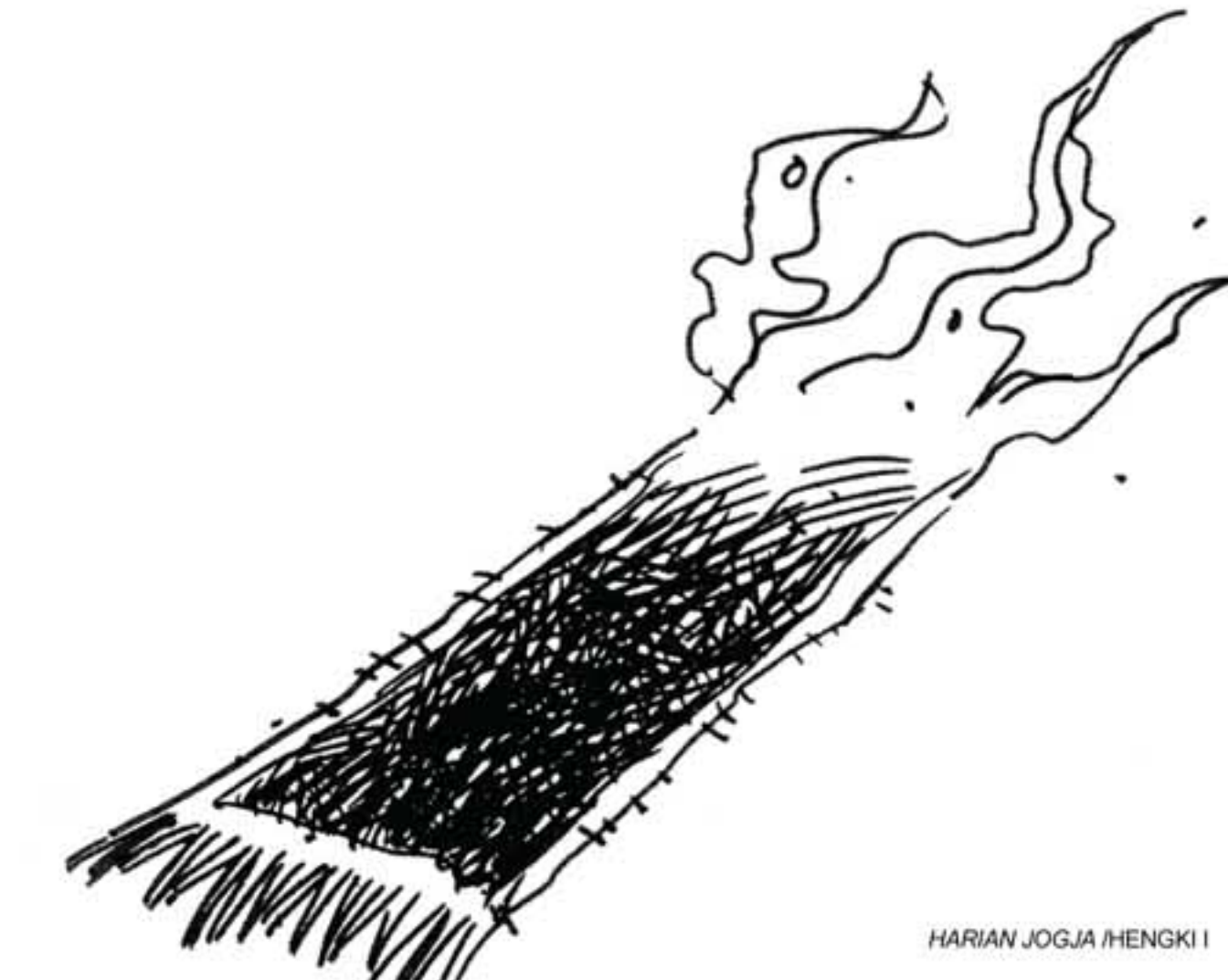
HARIAN JOGJA HENGKI 1

Perlu diketahui bahwa pendidikan karakter bangsa bukan semata-mata tanggung jawab guru, tetapi juga seluruh komponen masyarakat dan lingkungan keluarga. Guru hanya bertugas memberikan pembelajaran tentang pendidikan karakter bangsa melalui ilmu pengetahuan yang diterapkan dalam kurikulum