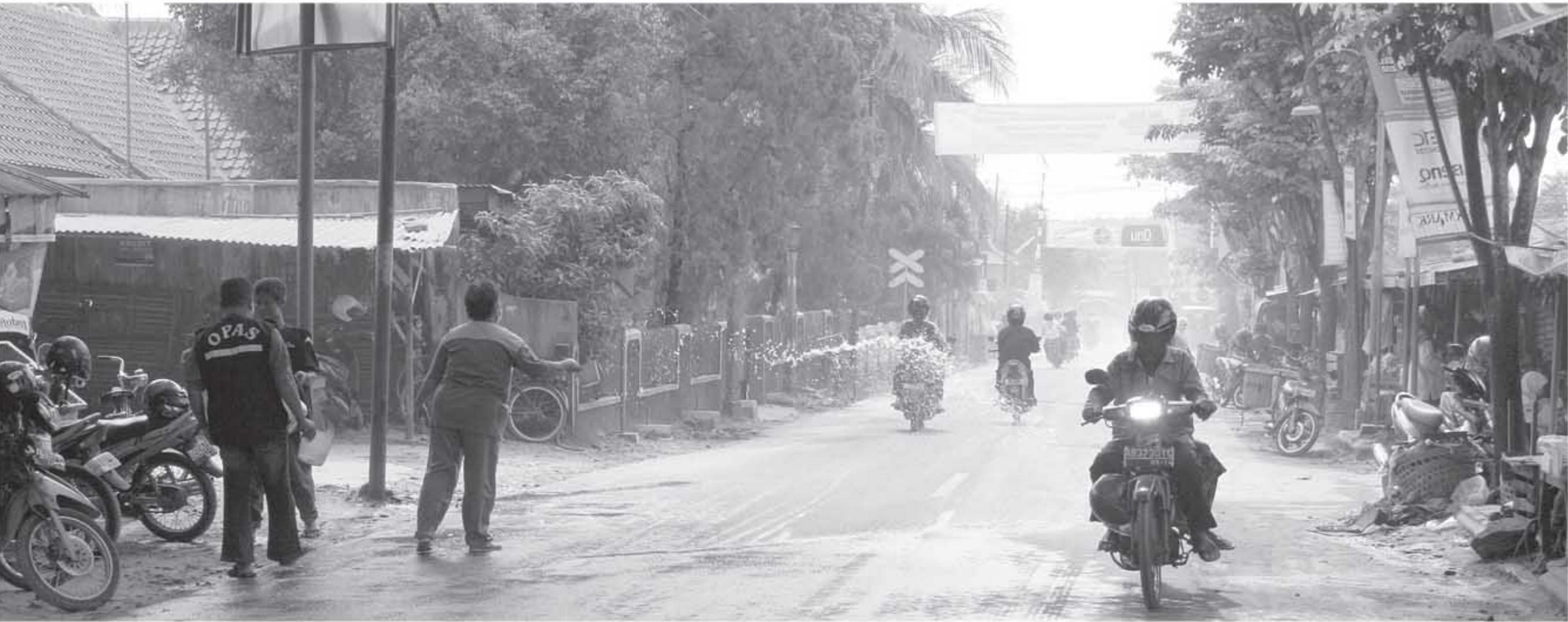
ABU VULKANIK: Sejumlah warga menyiram jalanan di depan Pasar Sentolo untuk mengurangi paparan abu vulkanik yang mengguyur Kabupaten Kulonprogo untuk kedua kalinya, Jumat (5/11).