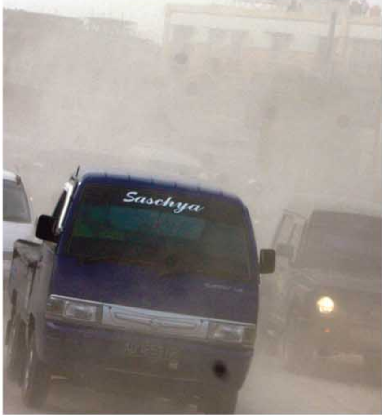
DEBU VULKANIK: Kendaraan melewati perempatan Jalan Kaliurang, yang penuh dengan debu vulkanik Gunung Merapi, Sabtu (30/10). Ledakan keras Gunung Merapi yang terjadi pada Sabtu (30/10) din hari yang disertai awan panas pekat mengakibatkan sejumlah kawasan di sekitar gunung itu tertutup debu vulkanik.

Selain merusak radiator, debu vulkanik juga ternyata berdampak buruk terhadap kaca mobil. Debu vulkanik bisa menyebabkan kerusakan serius pada kaca mobil. Penyebabnya adalah silika yang dikandung debu vulkanik ini.