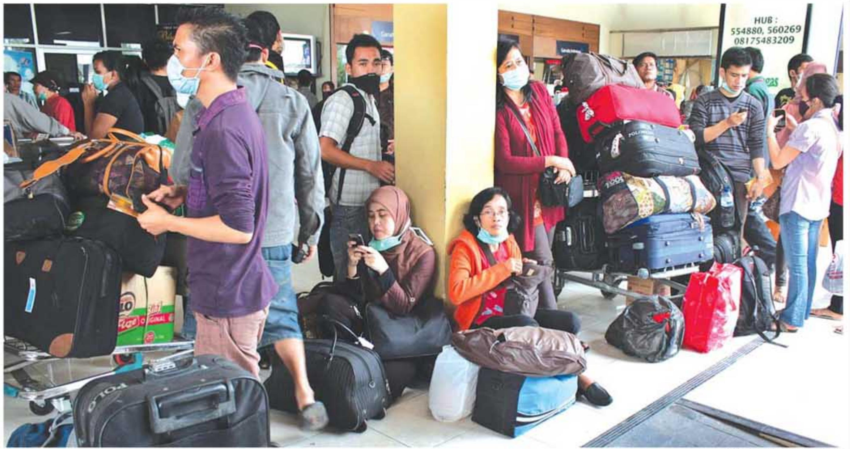
BANDARA DITUTUP: Ribuan calon penumpang berbagai maskapai penerbangan menanti kepastian keberangkatan. Bandara Adisutjipto Jogja menutup aktivitas penerbangan akibat

Sigit menambahkan, pedagang yang memilih tutup tidak hanya didominasi pedagang makanan tapi juga para pedagang asongan, pedagang aksesoris dan sebagainya.