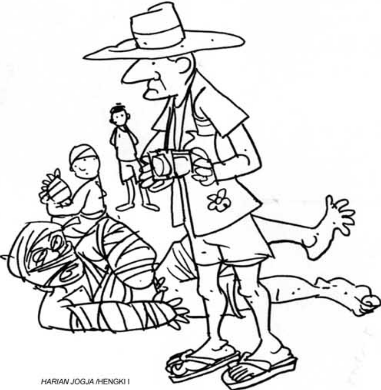
HARIAN JOGJA HENGKI 1

dengan pengembangan kecerdasan emosional (EQ) dan spiritual (SQ) yang kuat sehingga out put-nya generasi yang kurang mampu dalam mengolah rasa dan karsa.