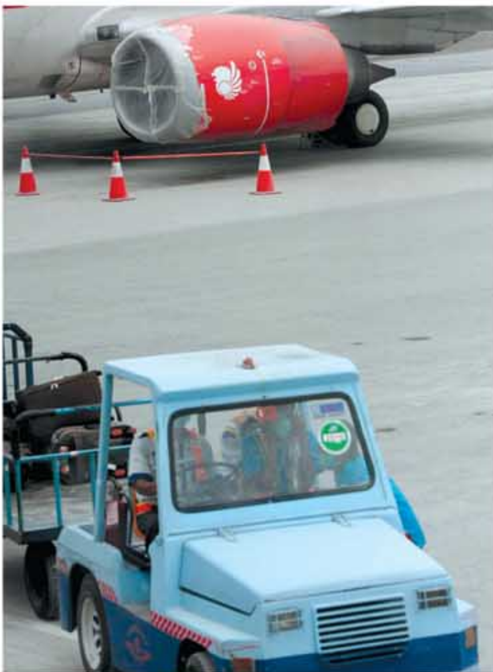
BANDARA DITUTUP: Mesin pesawat Lion Air ditutup dengan plastik untuk menghindari masuknya debu vulkanik di Bandara Adisutjipto Yogyakarta, Jumat (5/11).

Kasus terparah terjadi pada pesawat British Airways jurusan London