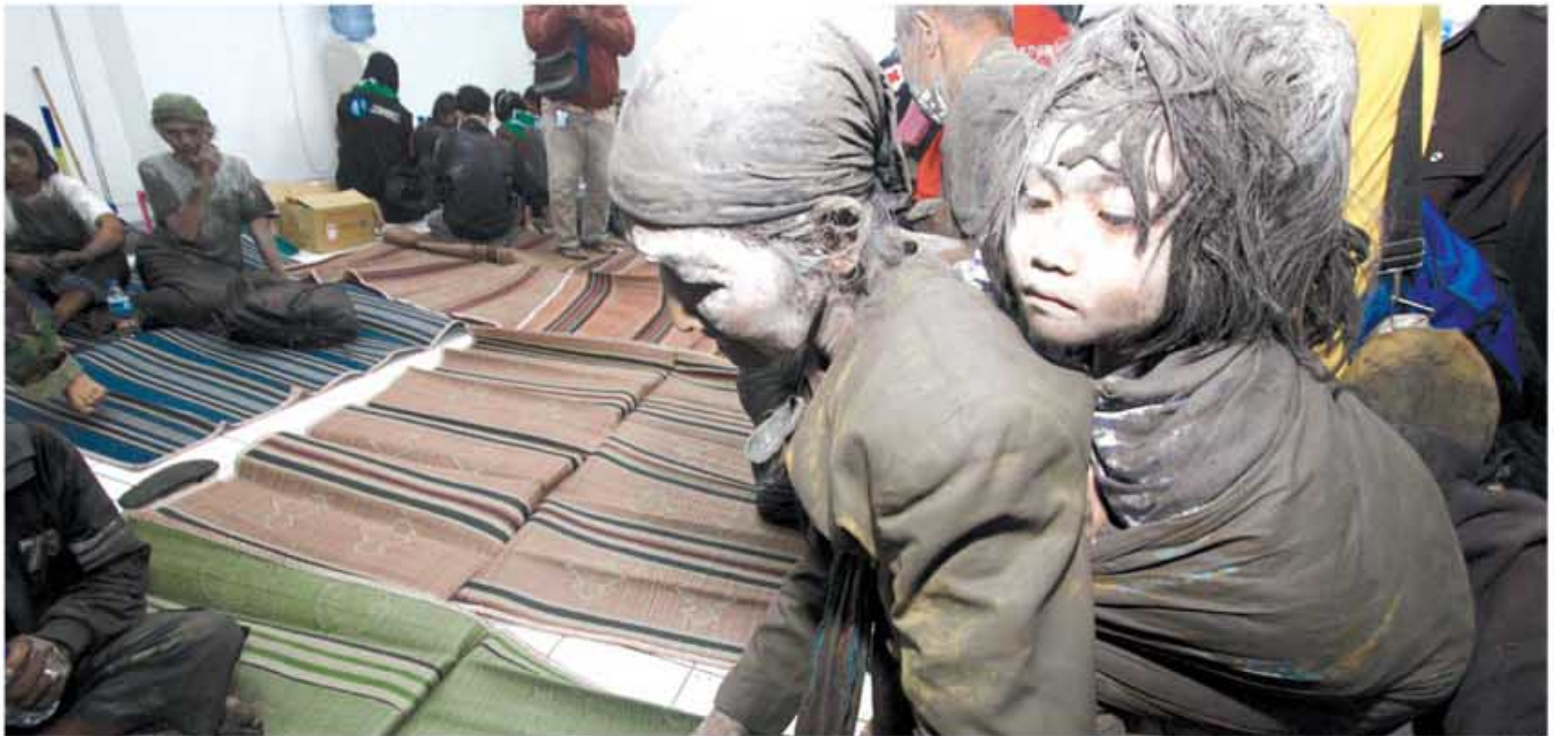
Pengungsi menggendong anaknya saat evakuasi di Stadion Maguwoharjo, Sleman, Jumat (5/11) malam.

Untuk itu, uluran tangan akan sangat membantu pengungsi untuk menemukan semangat hidup. Kiranya, hanya kepedulian sesama yang akan mengurangi penderitaan, kegelisahan, kebosanan dan trauma yang mendalam.