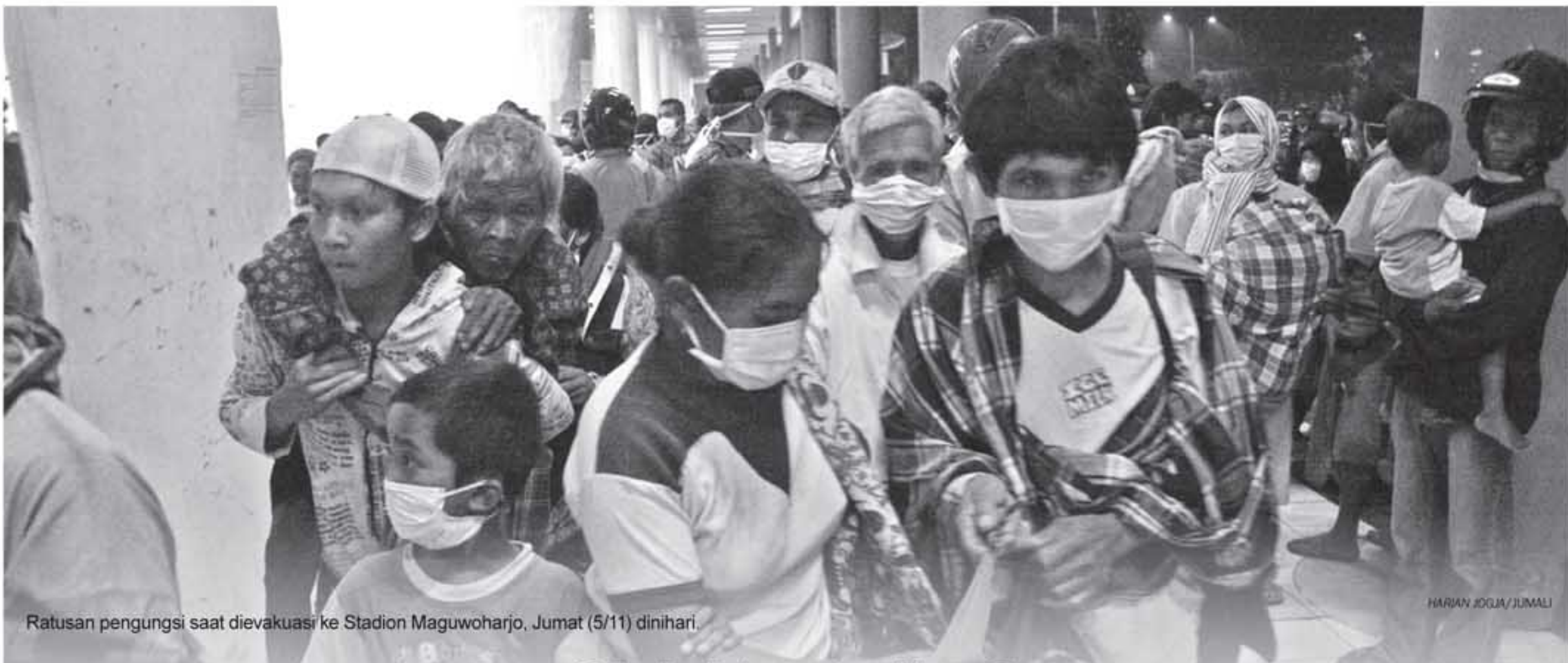
Ratusan pengungsi saat dievakuasi ke Stadion Maguwoharjo, Jumat (5/11) dinihari.

"Kita upayakan agar pengungsi selain aman juga bisa lebih nyaman dan tak melulu waswas dengan jarak yang aman ini," katanya.