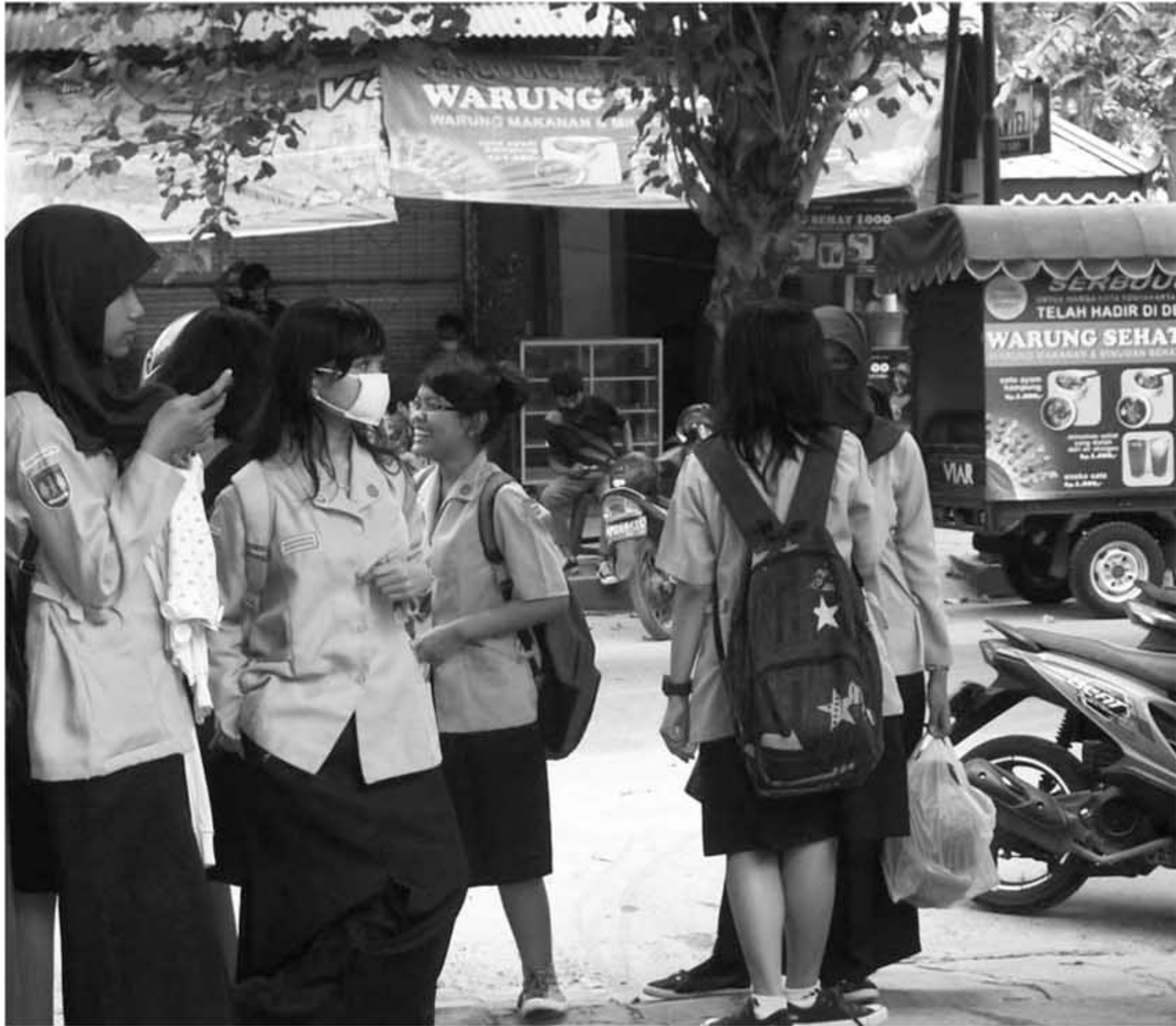
ANTISIPASI ISPA: Sejumlah siswa SMAN 6 Jogja menggunakan masker, untuk mengantisipasi infeksi saluran pernapasan (ispa) pascaerupsi Gunung Merapi, Jumat (5/11).