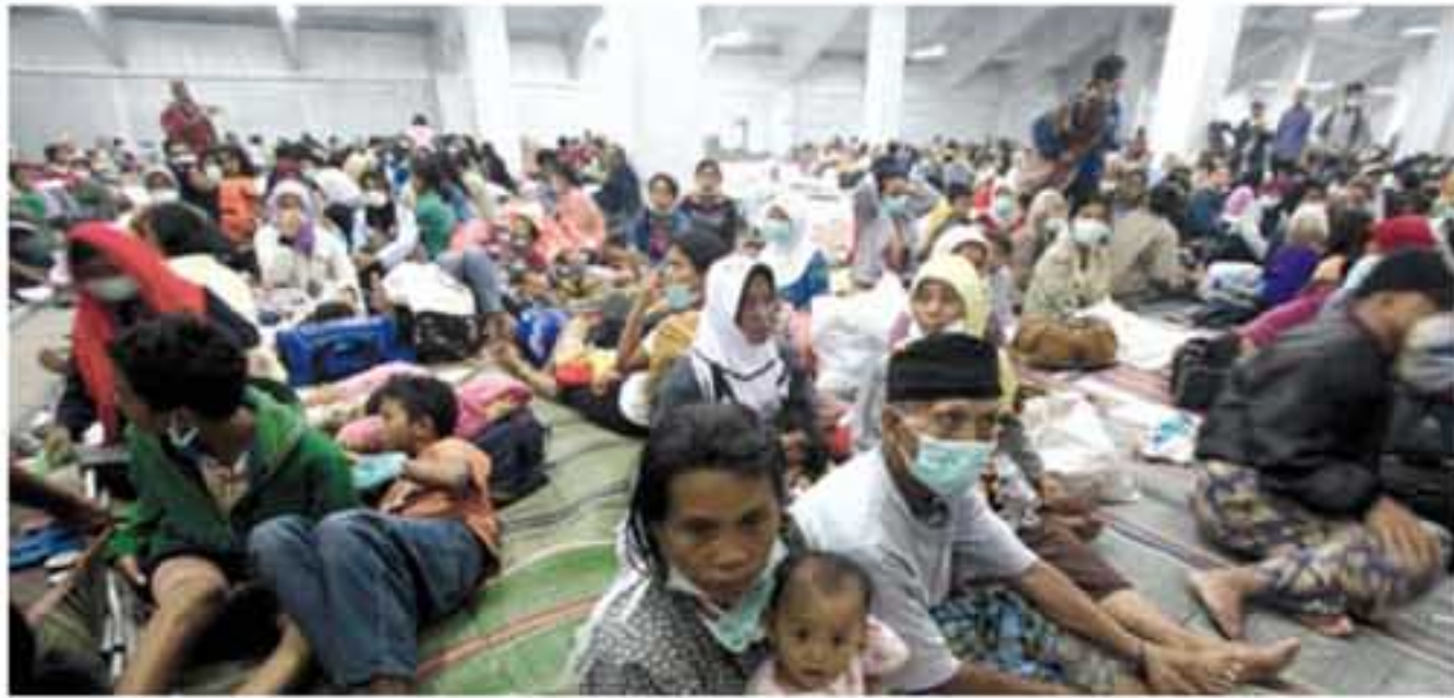
TABAH: Seorang pengungsi menggendong bayinya di Stadion Maguwoharjo, Sleman, Jumat (5/11) malam.