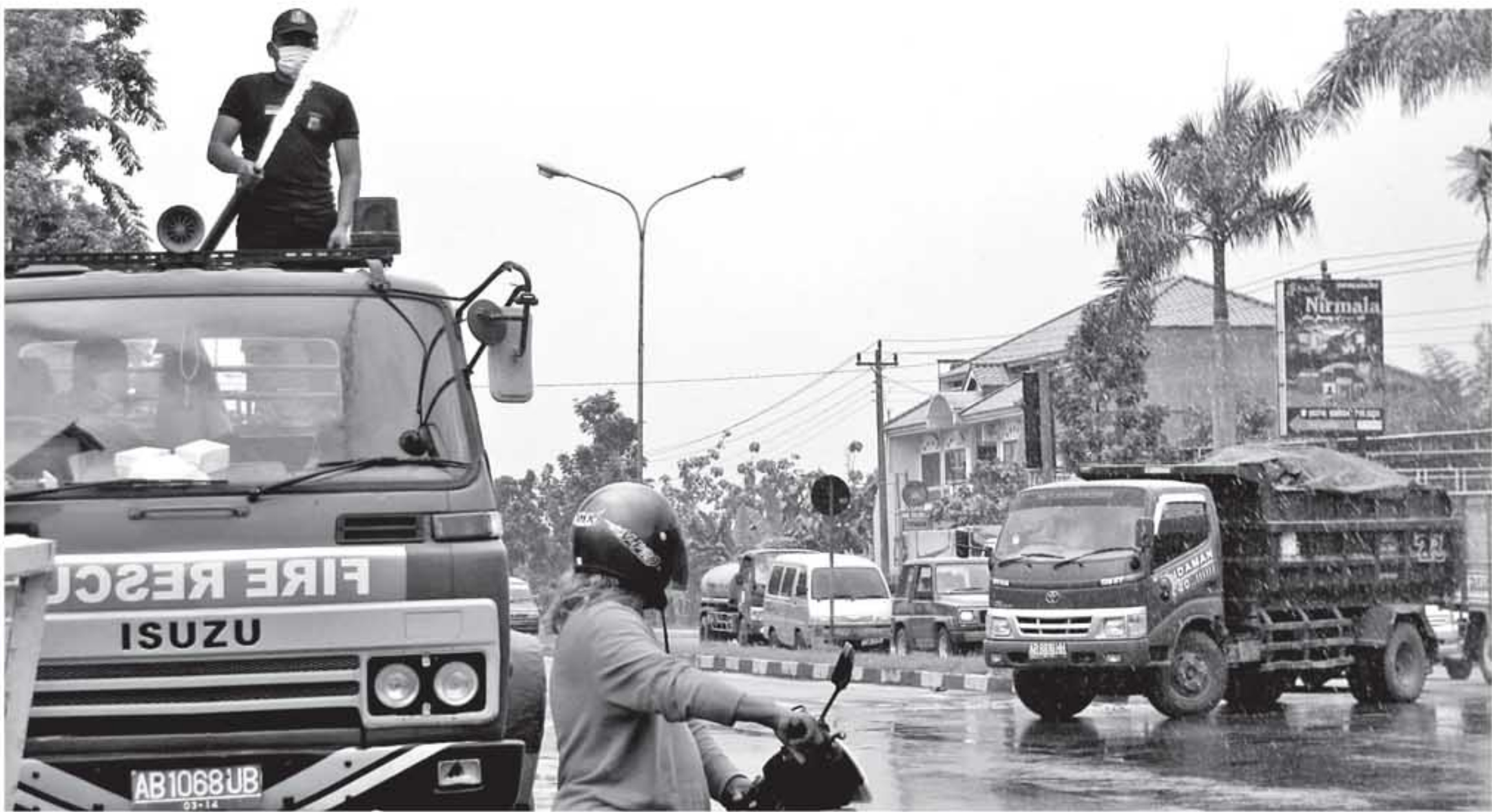
BERSIHKAN ABU: Petugas pemadam kebakaran dari Pemkab Bantul, membersihkan abu vulkanik akibat letusan Gunung Merapi, di perempatan Madukismo, Kasihan, Bantul,