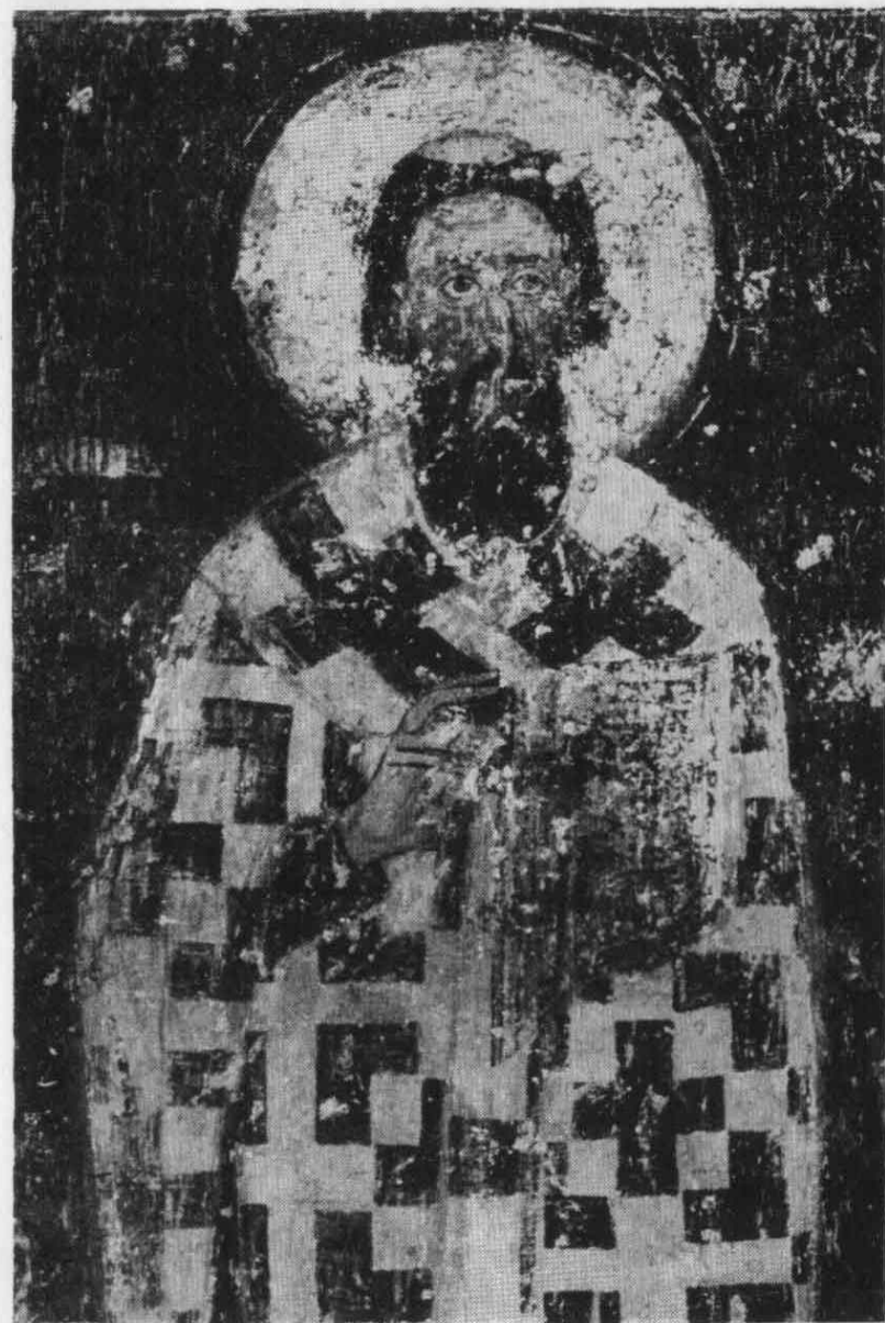
Свети Сава (фреска у Милешеви, XIII век)