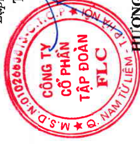
HƯƠNG TRẦN KIỀU DUNG