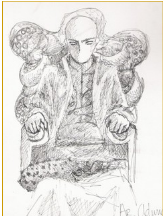
Dibujo: Claudia Arana (Fimbrehill)

AA: Es curioso que usted vea el problema desde un punto de vista solo social. Tenga en cuenta que yo quería abrir mercados y relaciones hacia la Tierra Me-